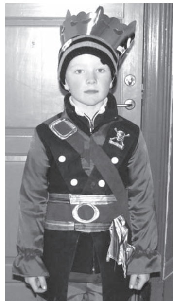
Så er udklædningen i orden.

Vi havde valgt en heldig dag da vejret var med os. Jeg vil også sige at der som sædvanligt var lagt stor energi i børnenes udklædning. Vi er selvfølgelig klar igen til næste år. mvh. Tove